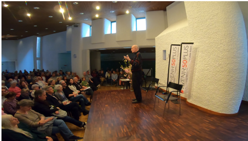
Anlass mit Bestsellerautor, Psychoanalytiker Dr. Eugen Drewermann